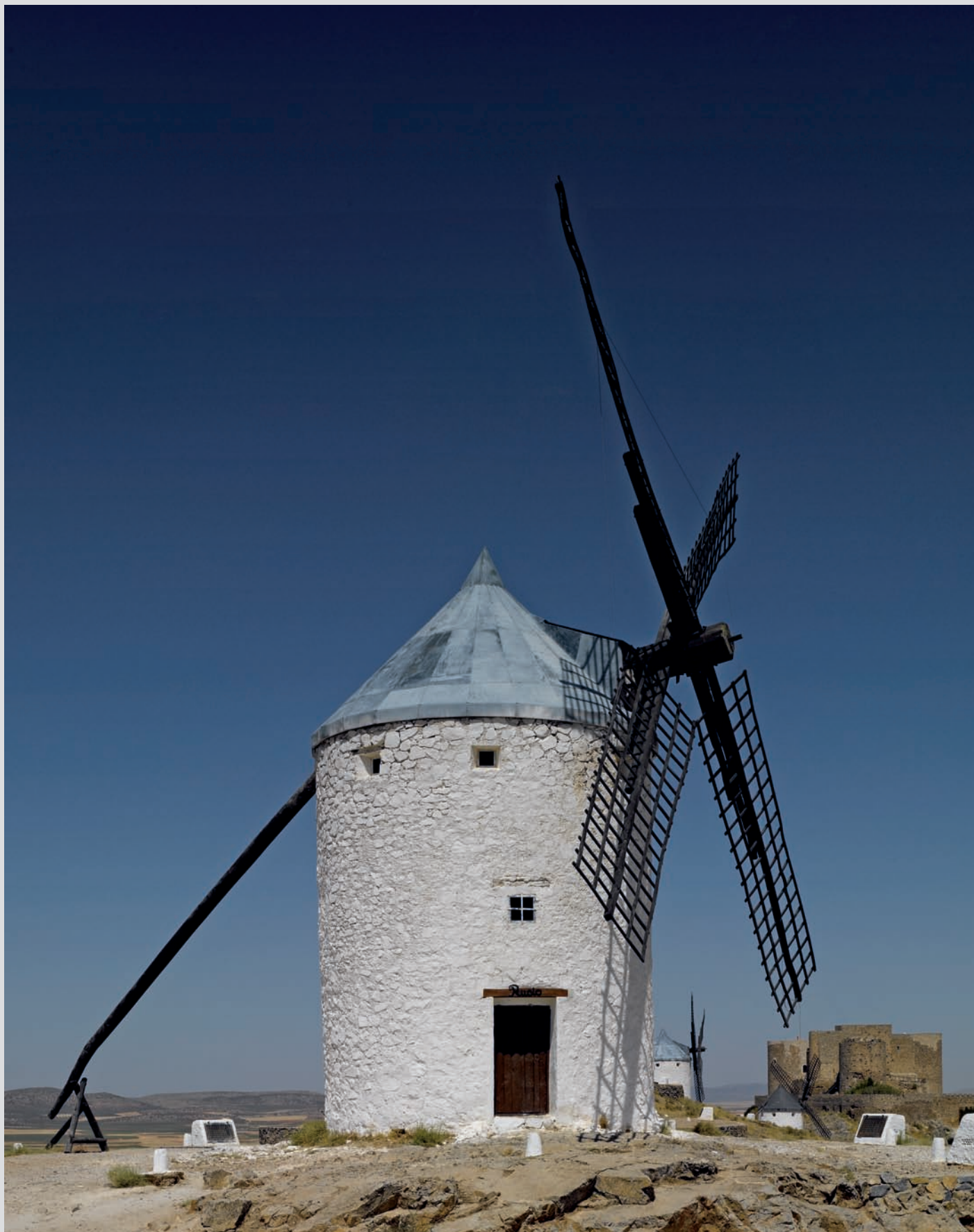
format 90 x 63 cm