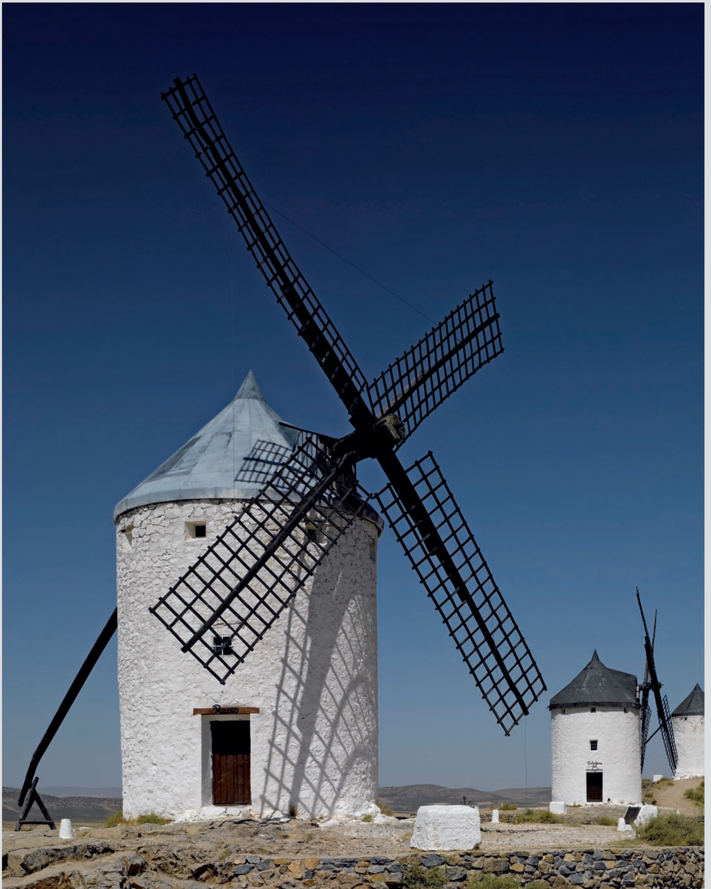
format 90 x 63 cm